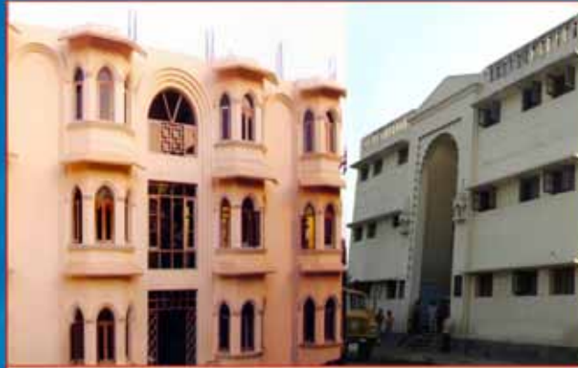
श्रद्धालुओं के निवास के लिए बनाया गया भवन तथा श्री गुरु रविदास लंगर हाल, सीर गोवर्धनपुर वाराणसी